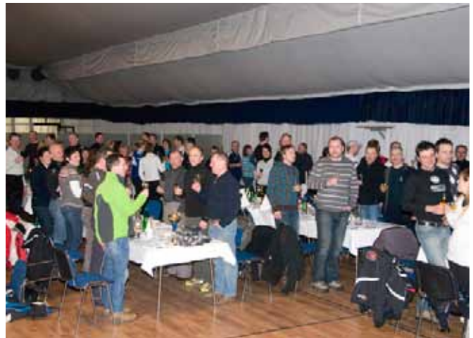
In vsi skupaj: "Kol'ko kapljic, tol'ko let..."

Hvala vsem za udeležbo in dobro voljo ter vljudno vabljeni, da se nam pridružite tudi naslednje leto.