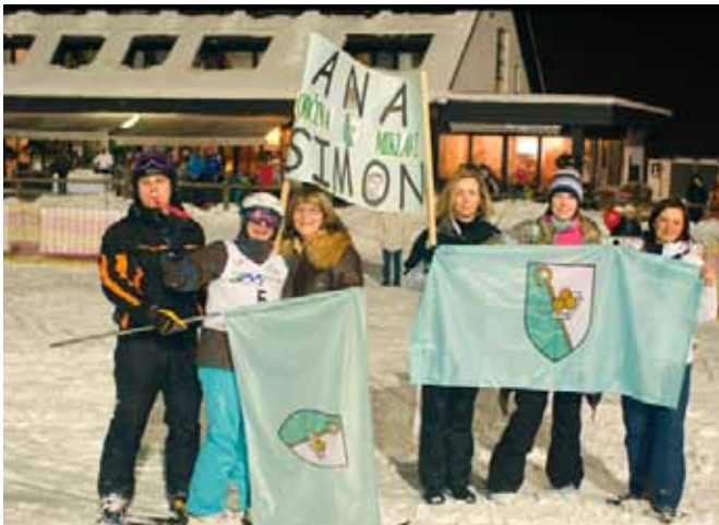
Navijačice in navijač iz občine Miklavž na Dravskem polju