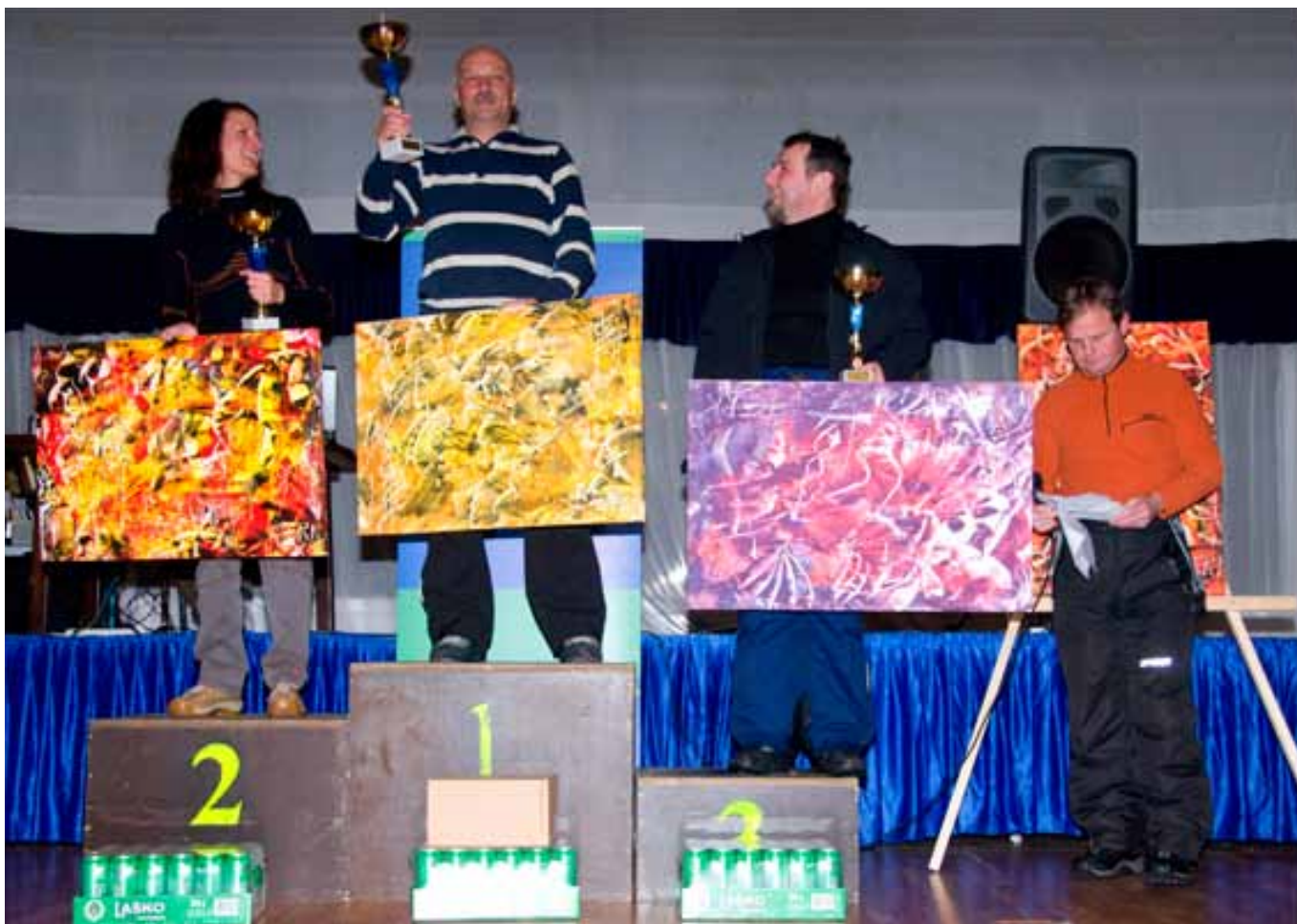
Zmagovalne ekipe (iz leve: občina Ljubno, občina Prebold, občina Sevnica)

za pogum, da so si sploh nadelni štartno številko. Ko so bila lica že rdeča in noge prezeble, je bil čas, da v prireditvenem šotoru razglasimo rezultate. Tekmovalo se je v štirih kategorijah: ženske juniorke do 40 let in seniorke nad 40 let, moški juniorji do 40 let ter seniorji nad 40 let. Prav tako so se nagradili najboljši ekipni rezultati, ki so seštevek točk najboljšega tekmovalca iz posamezne občine v vsaki kategoriji. Občina Prebold je bila ekipna zmagovalka, sledila ji je Občina Ljubno in Občina Sevnica. Brez nagrade ni ostala niti najštevilčnejša ekipa (MO Velenje), pa tudi tiste najslabše smo potolažili z nagradami. Ostali ekipni rezultati in rezultati po posameznih kategorijah so dostopni na spletni strani SOS ( www.skupnostobcin.si ). Prav tako smo v rubriki galerija objavili fotografije. Ob zaključku srečanja smo si bili vsi v eni stvari zagotovo enotni. Tradiciji se ne ugovarja, zato ji bomo zvesto sledili in naslednje leto ponovno priredili takrat že 9. veleslalom SOS.