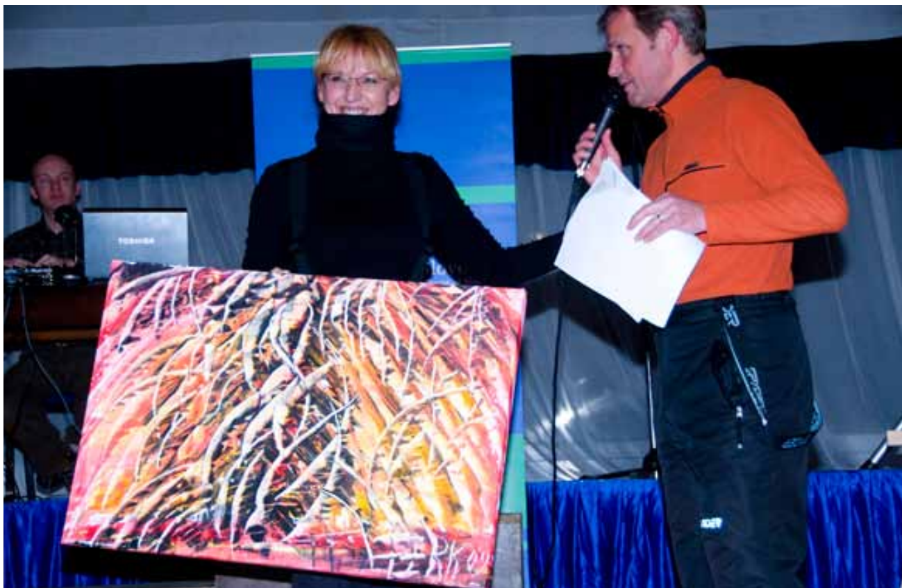
Nagrada MO Velenje za najštevilčnejšo ekipo