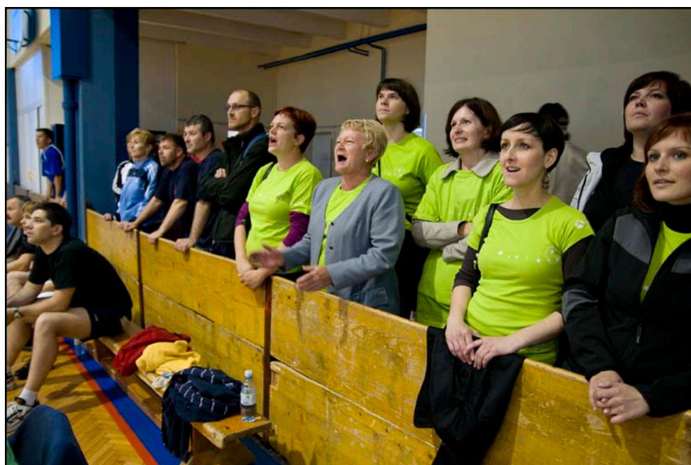
Tudi navijači so bili na trnih...