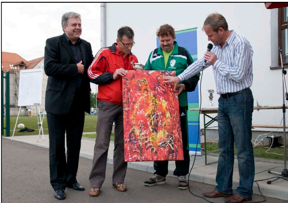
Podelitev pokala in nagrade Občini Ruše, zmagovalcu nogometnega dela turnirja.