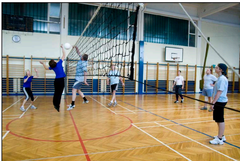
Odbojcarski del turnirja je bil še kako tekmovalen