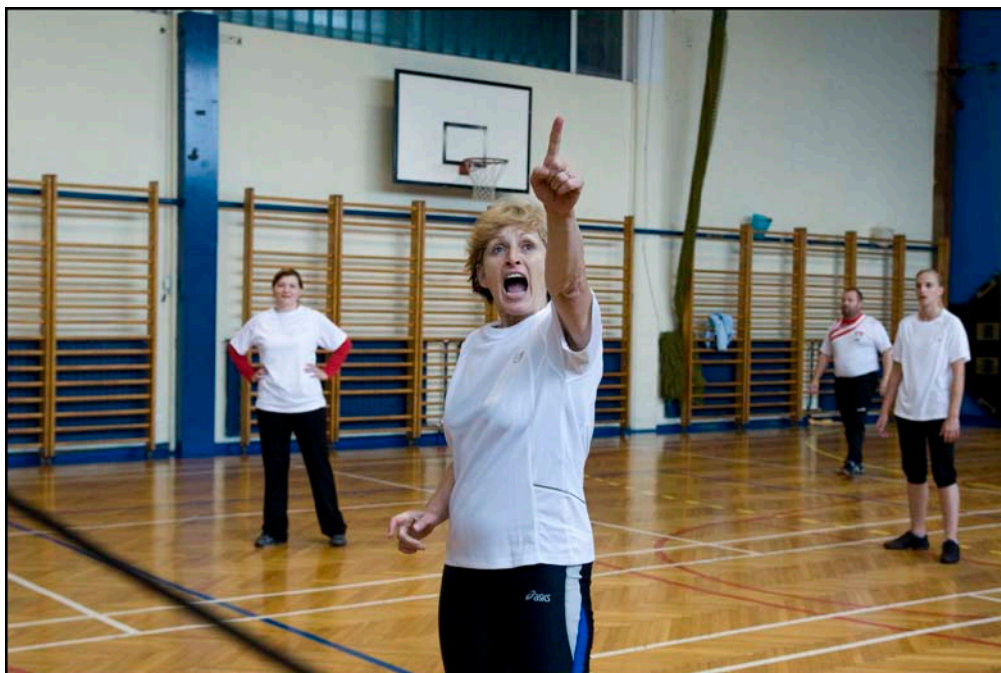
Utrinek: županja Občine Slovenska Bistrica se razburja na sodnika.