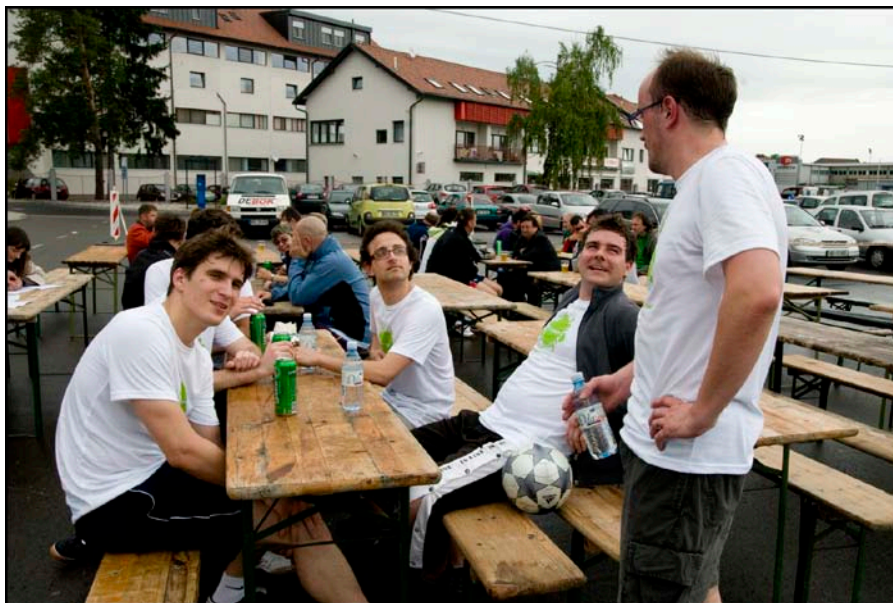
Ekipa glavnega sponzorja Xlab d.o.o. načrtuje taktiko za naslednje srečanje.